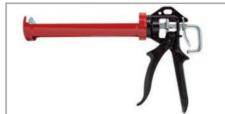
Дозирующий пистолет для картриджей 290 мл/310 мл ручной, металлический

МОНТАЖНЫЙ КЛЕЙ WIKO не содержит растворителей, легко поддается шлифовке или покраске. После затвердевания, клей устойчив к воздействию температуры от -30°C до +80°C. Благодаря высокому термическому сопротивлению, клей можно использовать вне помещений.